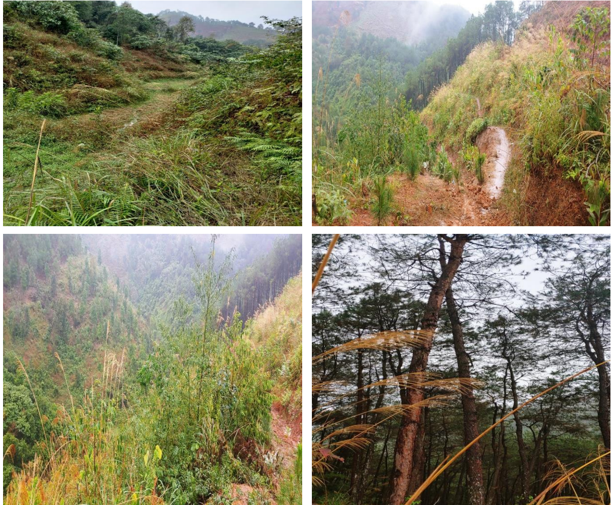
Hình 2. Một số hình ảnh hiện trạng khu vực thực hiện dự án